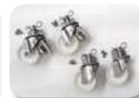
Ruedas de aparcamiento