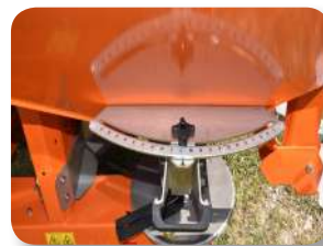
Regulación del punto de caída del abono