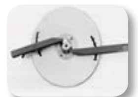
Disco y paletas 33-36m