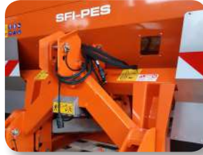
Sistema de pesaje integrado al bastidor