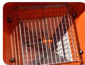
Criba de acero inoxidable