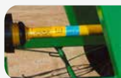
Transmission mécanique et actionnement pour le PTO