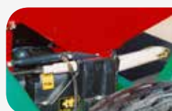
Ouverture et fermeture hydraulique