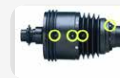
Transmission avec embrayage