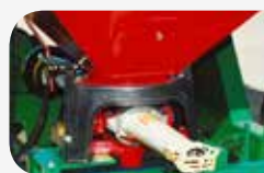
Groupe de distribution pendulaire VICON