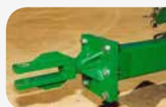
Accrochage tournante visé