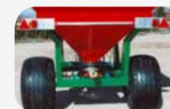
Pneus de flottation 500/50-17