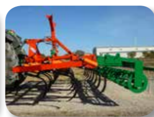
Enganche al tercer punto