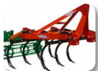
Dos filas de brazos