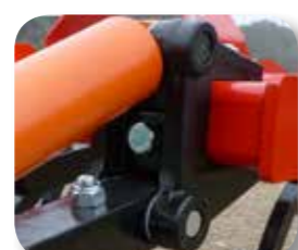
Sistema de fijación del brazo al chasis