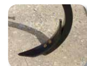
Reja reversible en acero al Boro