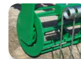
Rodillo desterronador con rodamiento protegido