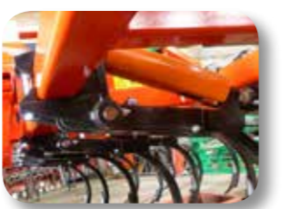
Chasis reforzado con tubo estructural