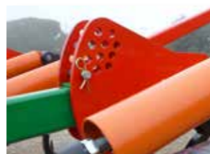
Sistema regulación del rodillo