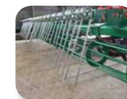
Rastra de púas de 10mm