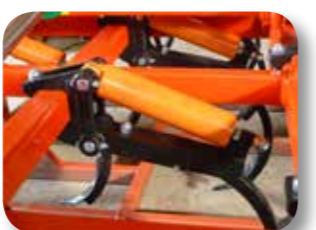
Regulación presión de los brazos