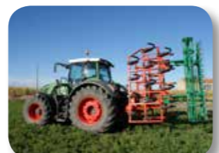
Nuevo sistema de plegado vertical