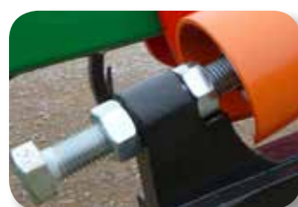
Regulación presión muelles