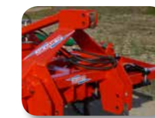
Enganche al tercer punto