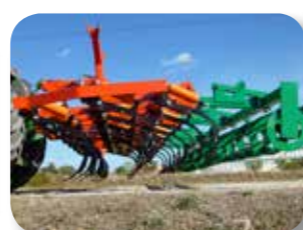
Tres filas de brazos