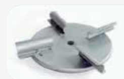
Disc escampador d'acer inoxidable