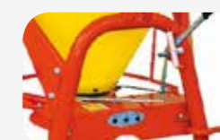
Enganxall al tercer punt CAT I-II