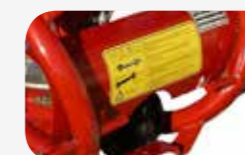
Accionament mecànic del disc mitjançant PTO a 540 rpm