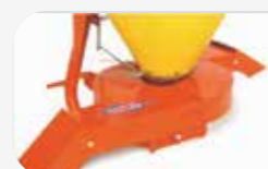
Localitzador lateral un o dos costats