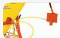
Comandament mecànic a distància