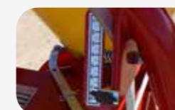
Sistema de Regulación manual