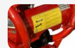
Accionamiento mecánico del disco mediante PTO a 540 rpm