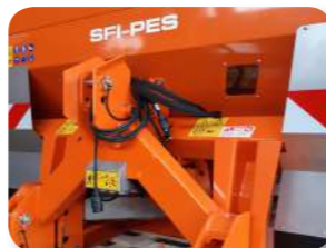
Sistema de pesatge integrat al bastidor