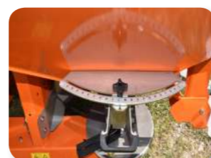
Regulació del punt de caiguda d'adob