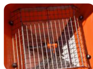
Sedàs acer inoxidable