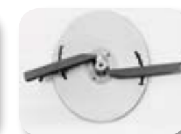
Disc i paletes 33-36m