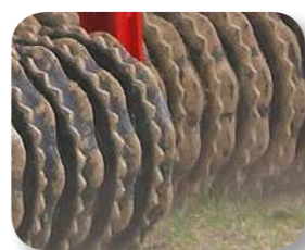
Discs de foneria